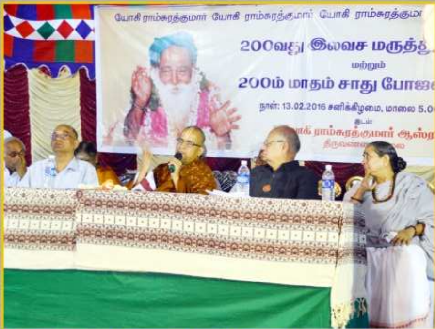
பிப்ரவரி 13 திருவண்ணாமலை யோகிராம்கரத்தாமர் ஆஸ்பத்திரியில் 200வது மாத சாதுபோஜனம் விழா மற்றும் 200வது இலவச மருத்துவ முகாம்