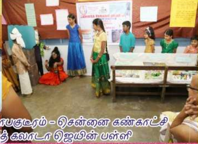
பிப்ரவரி 14 கோபகுடரம் - ஷென்னை கண்காட்சி திருகர் துரைசந்த் கலாடா ஜெயின் பள்ளி