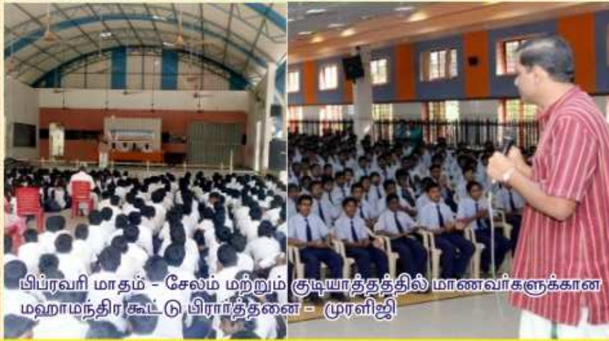
பிப்ரவரி மாதம் - சேலம் மற்றும் குடியாத்தத்தில் மாணவர்களுக்கான மஹாமந்திரகூட்டு பிரார்த்தனை - முரளிஜி