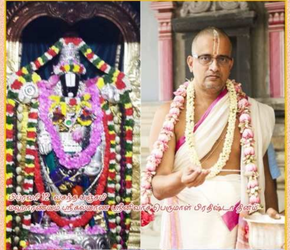
பிப்ரவரி 12 வசந்த பஞ்சமி மஹாரணயம் ஸ்ரீ கல்யாண ஸ்ரீனிவாசபெருமாள் பிரதிஷ்டா தினம்