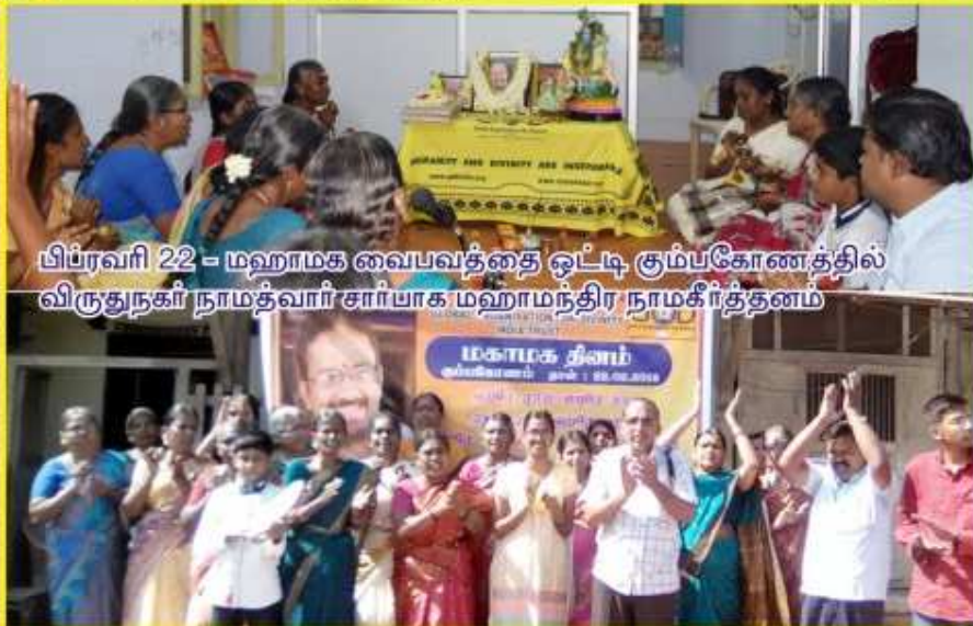
பிப்ரவரி 22 - மஹாமக வைபவத்தை ஒட்டி கும்பகோணத்தில் விருதுநகர் நாமத்வார் சார்பாக மஹாமந்திர நாமகீர்த்தனம்