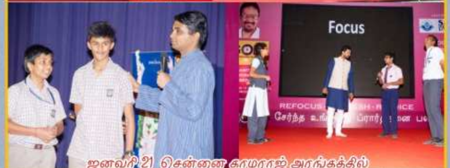
ஜனவரி 21 சென்னை காமராஜ் அரங்கத்தில் மகணவர்களுக்கான மஹாமந்திர கூட்டு பிரார்த்தனை முக்யநாதன்ஜி, ராமானுஜம்ஜி